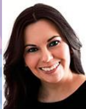
Sen. Laura Rojas Hernández (GPPAN)

En 2012 fue electa Senadora por lista nacional postulada por el Partido Revolucionario Institucional, para el periodo que concluirá en 2018.