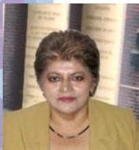
Dip. Areli Madrid Tovillo (GPPRI)

Preside la Comisión de Relaciones Exteriores Organismos Internacionales del Senado e integra las comisiones de Anticorrupción y Participación Ciudadana, Biblioteca y Asuntos Editoriales, y Relaciones Exteriores Europa. Participa como delegada ante la Unión Interparlamentaria, la Organización Mundial de Legisladores contra la Corrupción (GOPAC) y la Organización Mundial de Legisladores por un Medio Ambiente Equilibrado (GLOBE).