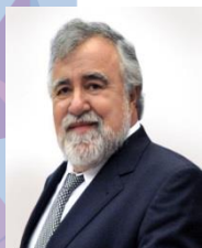
Sen. Alejandro Encinas Rodríguez

Actualmente es Diputada Federal integrante de la LXII Legislatura del Congreso de la Unión, Presidenta de la Comisión de Transparencia y Anticorrupción, e integrante de las Comisiones de Justicia y Puntos Constitucionales.