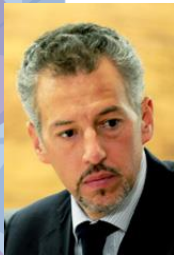
Joel Salas Suárez

Comisionado del Instituto Federal de Acceso a la Información y Protección de Datos