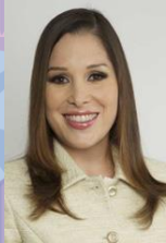
Ximena Puente de la Mora

Comisionada Presidenta del Instituto Federal de Acceso a la Información y Protección de Datos