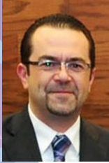
Rosendoevgueni Monterrey Chepov

Comisionado del Instituto Federal de Acceso a la Información y Protección de Datos